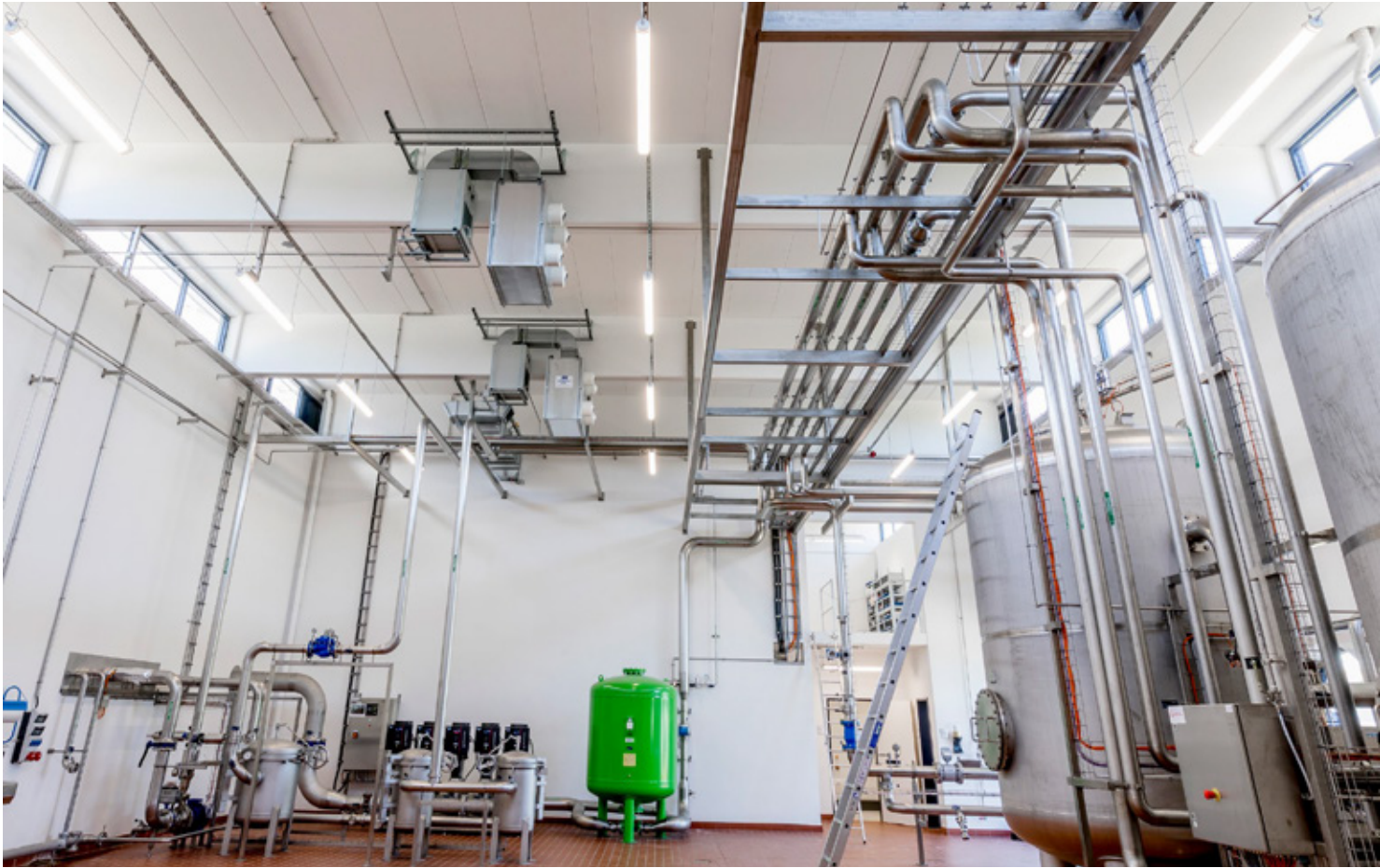
Molkerei Gropper GmbH & Co. KG, Bissingen