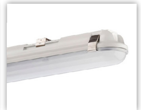
Hochwertige Edelstahl Clipse